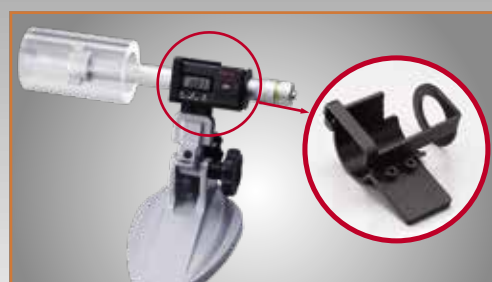
HOUDER VOOR SCHROEFMAAT 04AZB157 incl. schroefmaatstatief 156-101-10