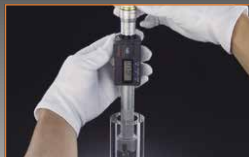
Typische toepassing van Holtest